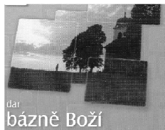
dar bázně Boží